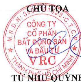
TU NHƯ QUỲNH